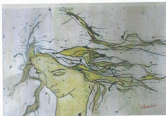
Le superbe portrait de sa fille

Nous redisons ici notre peine et notre immense reconnaissance à son épouse qui, elle-même, s'est beaucoup dévoué pour nous.