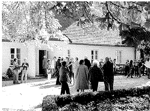
Visite à la maison de Chopin

Enfin, à l'hôtel, un repas barbecue sur les rives du lac en présence de superbes danses folkloriques clôturèrent cette première journée.